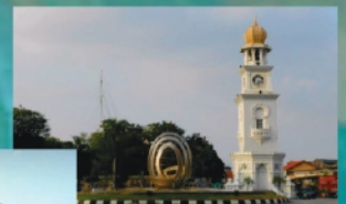
विक्टोरिया क्लॉक टावर