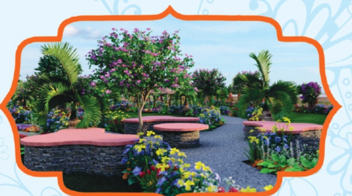
Tapovan Sitting Area