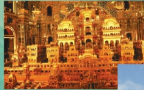
सोनी जी की चिसियाँ