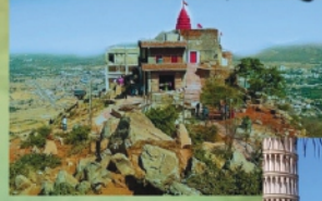
पुष्कर में सावित्री मंदिर