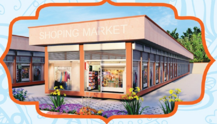
Retail Shop Area