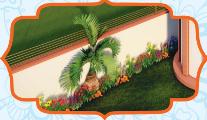
Outer Boundary with Wire Fencing