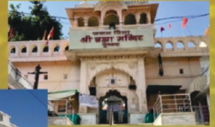
पुष्कर में ब्रह्मा मंदिर