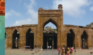
अढ़ाई दिन का झोपड़ा