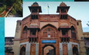
अजमेर गर्वमेंट म्यूजियम