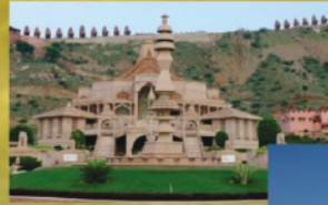
नारेदी जैन मंदिर