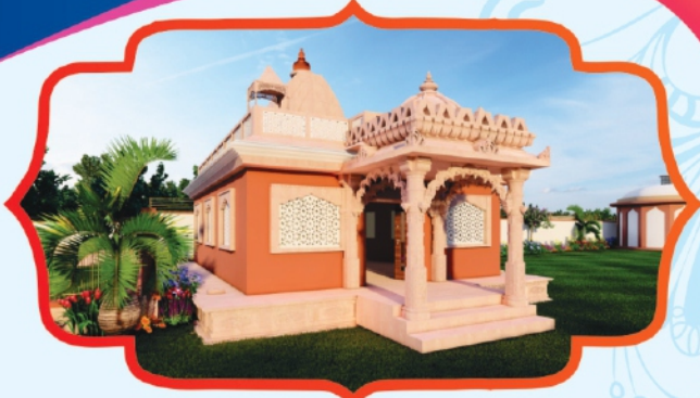
Shri Ram Temple