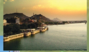
आना सागर झील