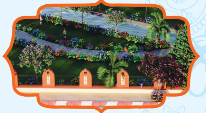
Tapovan Boundary wall