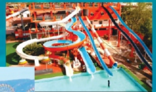
बिड़ला सिटी वाटर पार्क