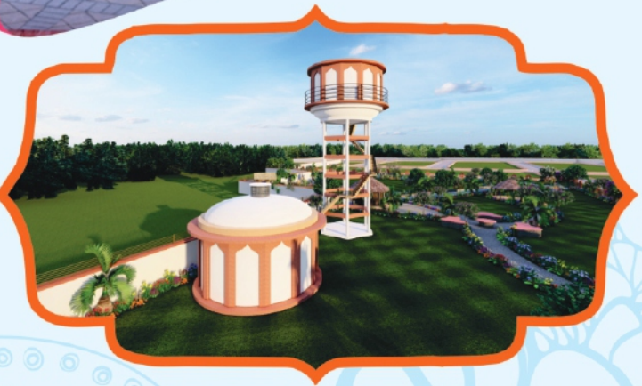
CWR & Overhead Water Tank