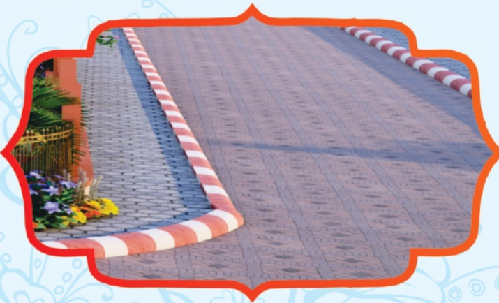
Interlocking Tiles Road