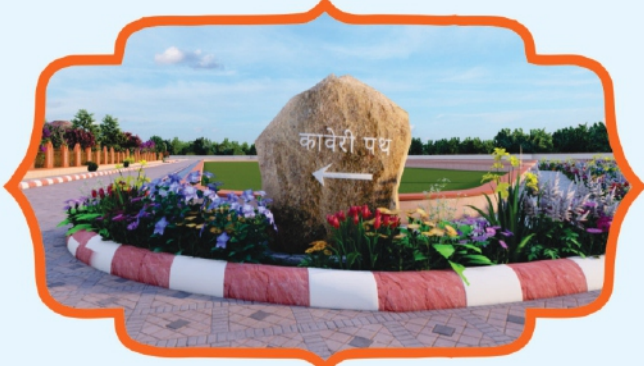
Arrow Path Demarcation