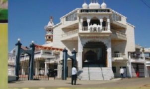
साई बाबा का मंदिर